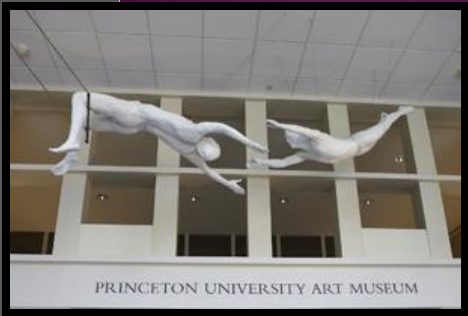
«Circus acrobats» 1982