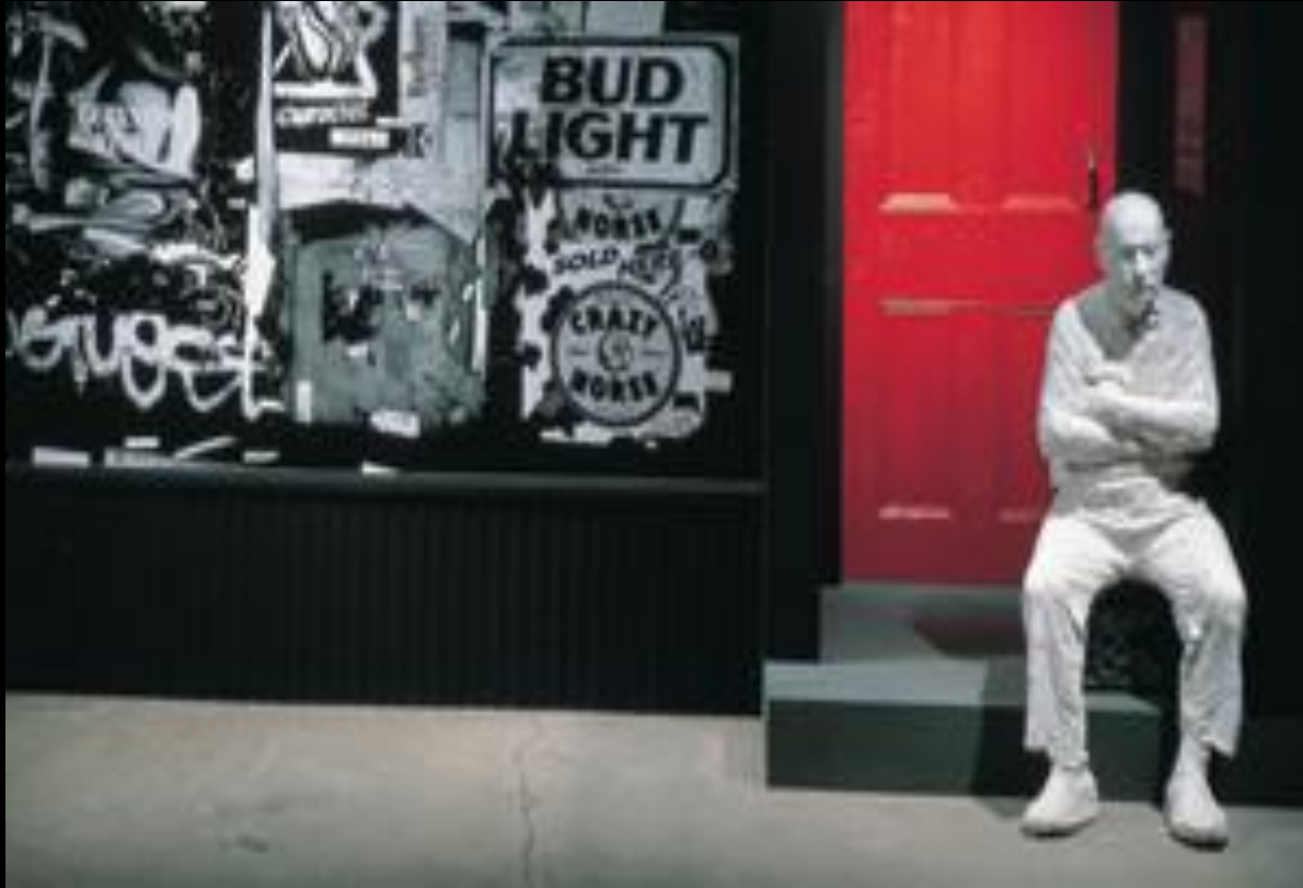
«Liquor store» 1994