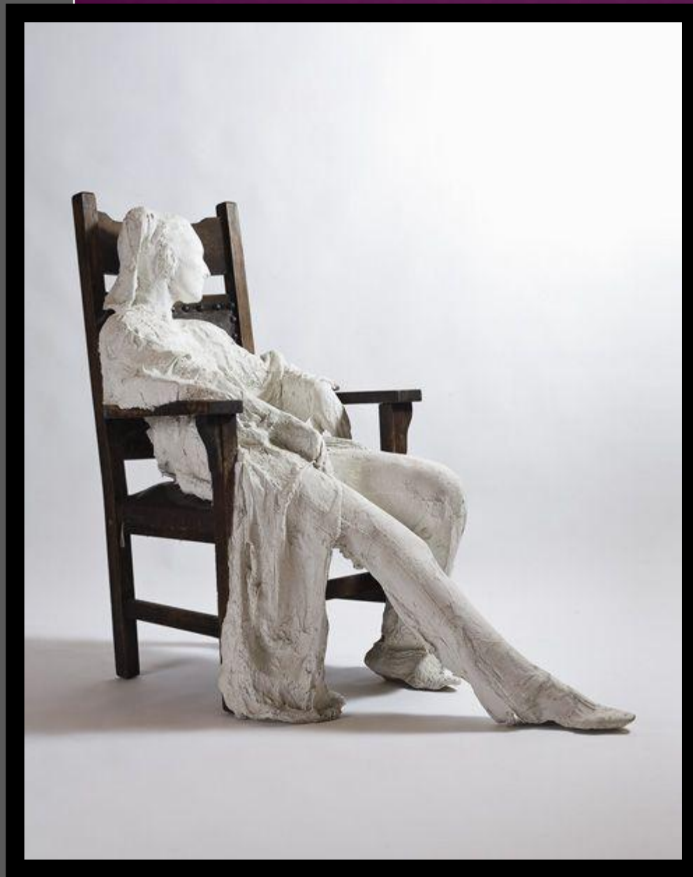
«Woman in armchair» 1994